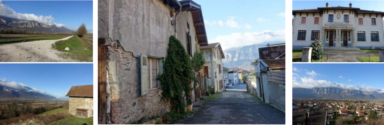
PLANCHE 2. RISQUES NATURELS - PPRn

PROJET ARRÊTÉ LE 11 JUIN 2025 PROJET APPROUVÉ LE 21 JANVIER 2026