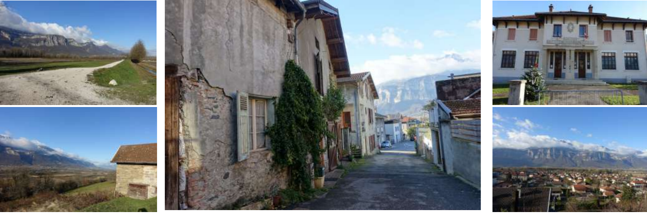
PLANCHE 2. RISQUES NATURELS - PPRI

PROJET ARRETÉ LE 11 JUIN 2025 PROJET APPROUVÉ LE 21 JANVIER 2026